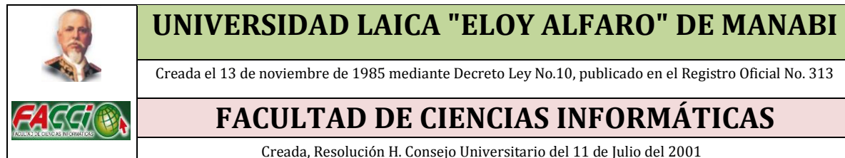
Cuadro N° 3